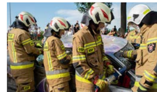
Pietrzejowice i Rawałowice